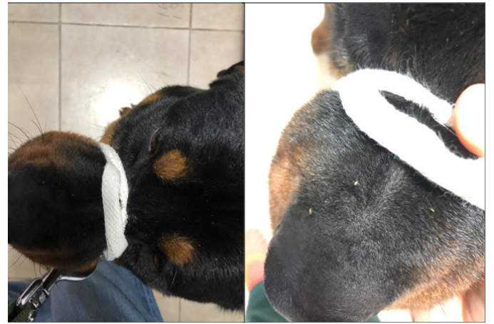
Şekil 1. Linognathus setosus ile enfeste köpek, orijinal

Bu çalışmada toplanan dişi ve erkek L. setosus 'lara ait bazı morfolojik yapılar ve ölçümler Şekil 3'te gösterilmiştir. Ölçümlerde dişi L. setosus 'ların ortalama büyüklüğünün 2,34 mm olduğu belirlenmiştir. Morfolojik incelemelerde başın uzunluğunun genişliğinden biraz daha fazla olduğu, antenlerin neredeyse başın orta kısmından çıktığı, preantennal bölgenin iyi gelişmiş, lateral kenarlarının düz ve apeksin ise küt sonlandığı belirlenmiştir. Ayrıca postantennal bölgenin lateral kenarlarının birbirlerine paralel oldukları belirlenmiştir. Abdomenin geniş ve oval yapıda, ince setalarla kaplı olduğu ve ventral yüzeye göre dorsal yüzeyinde daha sık seta bulunduğu gözlenmiştir (Şekil 3A). Gonopofizlerin kısa ve geniş yapıda olduğu, posterior marginlerinin geniş ve yuvarlağımsı olduğu görülmüştür. Ayrıca kısmen uzun bir seta sırasına sahip olduğu belirlenmiştir (Şekil 3B). Erkek L. setosus 'ların da genel olarak dişiye benzemekle birlikte, daha küçük bir vücut yapısına sahip olduğu görülmüştür. Abdomenin dişiye kıyasla daha az setalı (Şekil 3C) olduğu ve dorsal yüzeyin posterior kısımlarının neredeyse setasız olduğu belirlenmiştir. Genitalinin iyi gelişmiş ve kalkan şeklinde olduğu görülmüştür (Şekil 3D). Belirlenen özellikler ve ölçümler sonucu elde edilen bulguların Ferris (8) ve Tuff (9)'in belirtmiş olduğu morfolojik özelliklerle uyumlu olduğu tespit edilmiştir.