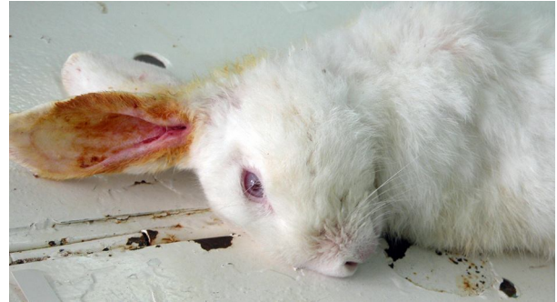
Şekil 3. P. cuniculi enfestasyonuna bağlı tortikollisin klinik görünümü

Menenjit bulguları görülen tavşan tedaviye başlanılan ikinci günde kaybedilmiştir. Kulak lezyonu şekillenmiş diğer üç tavşanda tedaviyi takip eden birinci haftanın sonunda kaşıntı ve deri bulgularının büyük oranda azaldığı tespit edilmiştir. İkinci hafta sonrasında klinik ve parazitolojik incelemelerde etkene rastlanmamış ve klinik olarak iyileşme sağlanmıştır. Hasta hayvanlarla temas halinde olan ve koruma amaçlı ivermektin uygulaması yapılan tavşanların hiçbirinde enjeksiyon sonrasında uyuz etkeni ve kulak lezyonları görülmemiştir.