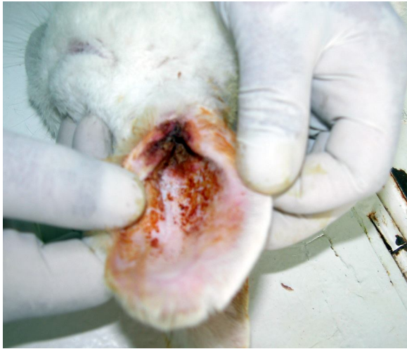
Şekil 1. Dış kulak yolu ve kulak kepçesinde P. cuniculi 'ye bağlı eksudasyon ve kalınlaşma.

Hasta hayvanların genel muayenesinde kulak kepçesinde yoğun eksudasyon ve kalınlaşma (Şekil 1) görülmüş, kulaktan alınan materyalde stereomikroskopta P. cuniculi 'nin yumurta, larva, nimf ve erginleri tespit edilmiştir (Şekil 2).